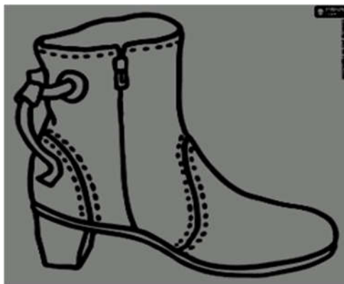
ОБУВЬ ИЗ КОЖЗАМЕНИТЕЛЯ